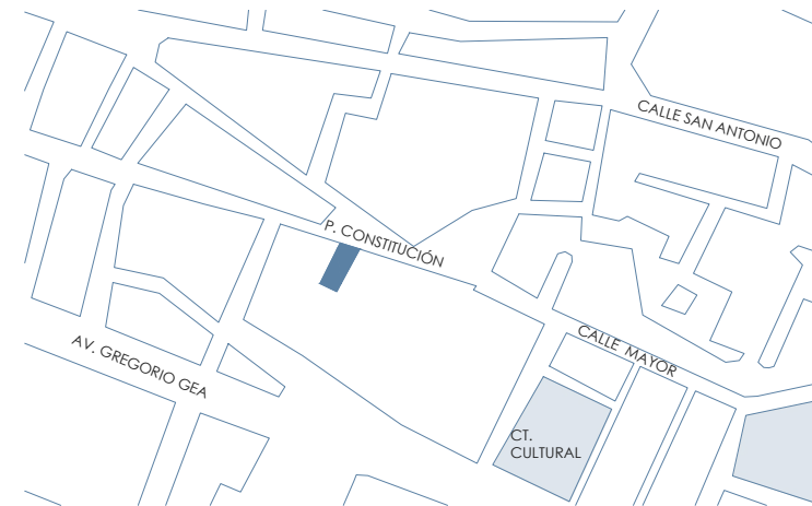
UBICACIÓN EN PLANTA